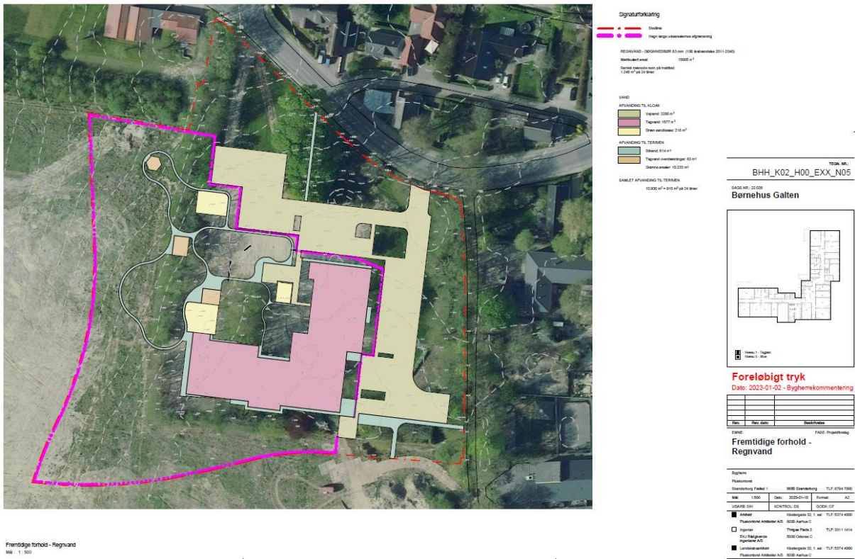
Figur 4. Oversigtsplan for fremtidige forhold. Oplyst af ansøger.