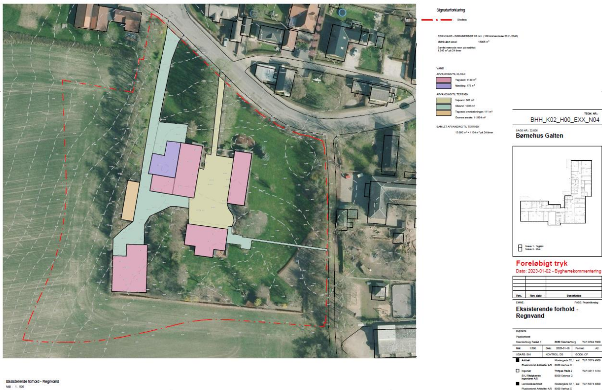
Figur 1. Oversigtsplan for eksisterende forhold. Oplyst af ansøger.